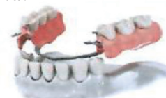
Náhrada pomocí zubní protézy

Použití implantátů v tomto případě potlačuje nutnost zubních protéz, které mohou způsobovat nepohodlí, úbytek kostní hmoty a snižovat kvalitu života.