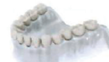
Celková zubní náhrada