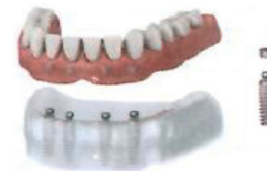
Implantáty pro stabilizaci zubní protézy

Implantáty přispívají ke stabilitě a kotvení protéz. Zubní protézy bez implantátů nejsou nejlepší náhradou přírodních zubů. Provází je resorpce kosti, nestabilita, záněty dásní, snížená schopnost žvýkání a pocit celkového nepohodlí. Vložení implantátů pro ukotvení zubní protézy přispívá ke zlepšení všech těchto parametrů.