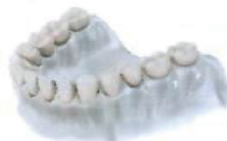
Náhrada více implantáty