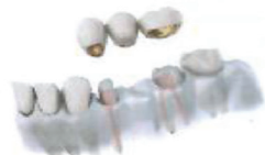
Náhrada pomocí můstku

Jeden implantát s korunkou je ideálním řešením. Implantát představuje pohodlné a estetické řešení a může eliminovat nutnost broušení